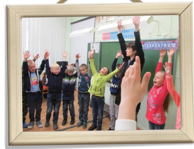
«ТАЙНАЯ КОМНАТА» – ИГРЫ НА СПЛОЧЕНИЕ