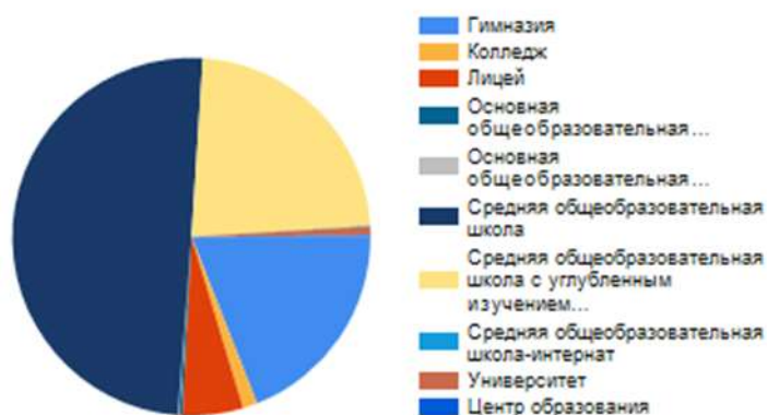
Выпускники текущего года, участники ОГЭ по предмету в Свердловской области по типам образовательных организаций