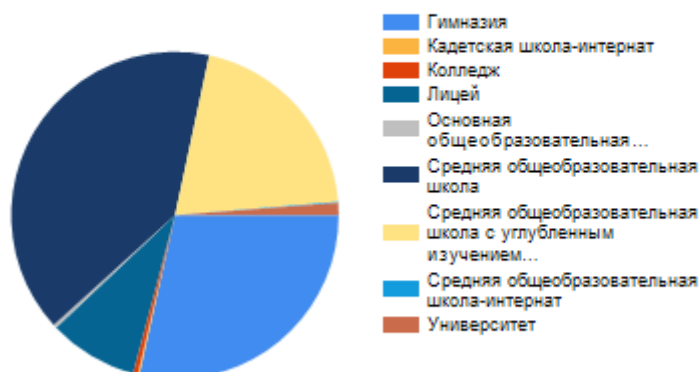
Выпускники текущего года, участники ОГЭ по предмету в Свердловской области по типам образовательных организаций

ВЫВОД о характере изменения количества участников ОГЭ по предмету: В целом, с 2016 года сохраняется тенденция значительного увеличения количества сдающих предмет в форме ОГЭ. Общее количество выпускников в 2019 году превысило количество выпускников, выбравших данный экзамен на итоговую аттестацию в 2018 году. При этом, наблюдается рост количества сдающих экзамен из числа выпускников основной школы, гимназий, средних общеобразовательных школ и средних общеобразовательных школ с углубленным изучением отдельных предметов. При этом, данная динамика прослеживается практически во всех территориях Свердловской области.