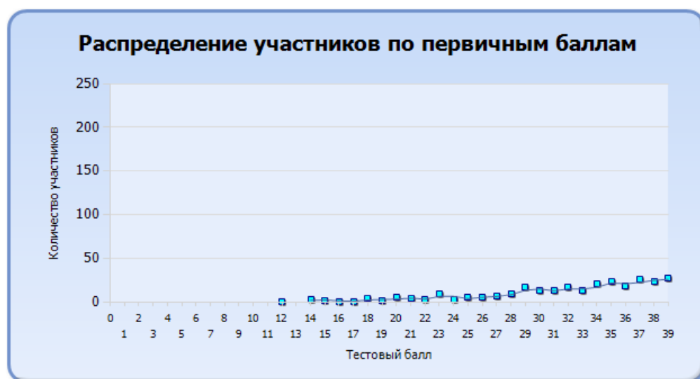
Диаграмма распределения участников ОГЭ по учебному предмету по тестовым баллам в 2019 году: