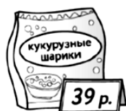
Б) Кукурузные шарики